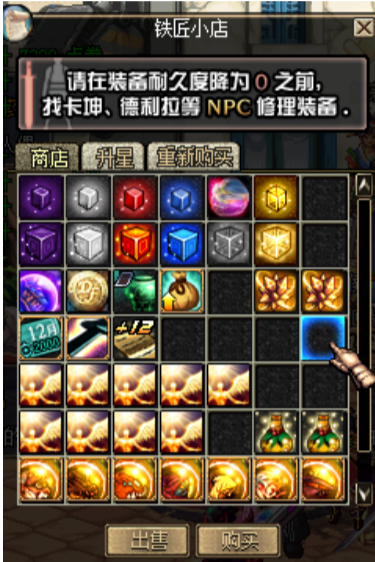
小推车里面可以兑换点券。王者宝珠、+12 强化卷、各种晶体、史诗碎片设计图等