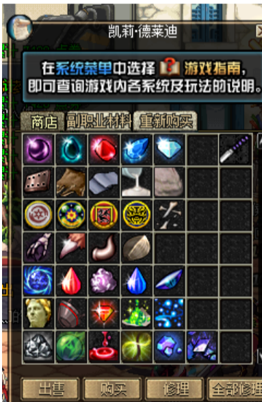
各远古图门票所需材料都在凯丽这购买，比如灵魂晶石、灾难征兆这些